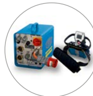
Kompakte Steuerung, hand- liche Funkfernbedienung mit Bildschirm

Die Wandsäge WSE1621 wurde für universelle Anwendungen und den täglichen Einsatz am Bau entwickelt. Das neu konzipierte System setzt dank der digitalen Ausstattungsmerkmale sowie der kompakten und leichten Komponenten neue Standards im Bereich Wandsägen. Der superleichte Blattschutz sowie der Antriebsmotor